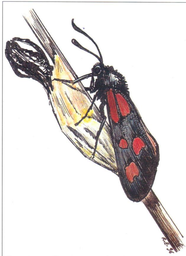
Dessin R. Essayan